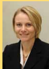
Christiane Staab Bürgermeisterin Stadt Walldorf