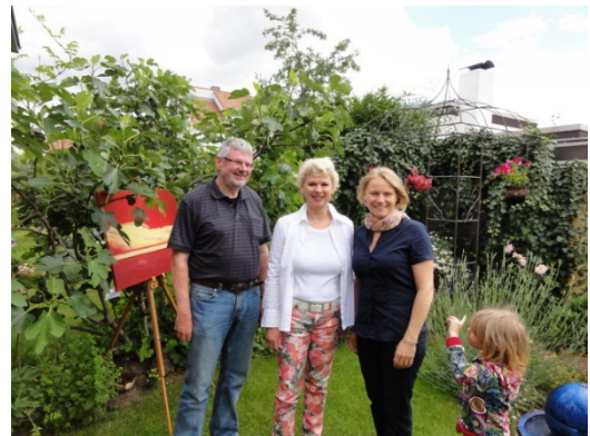
Die ersten Besucher